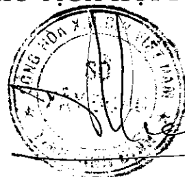
Đào Quý Tiêu