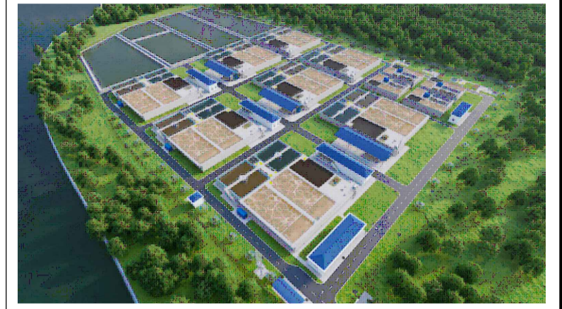
KHU VỰC LẬP QUY HOẠCH