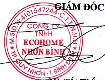
Hà Tất Thắng