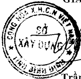
Trần Viết Bảo